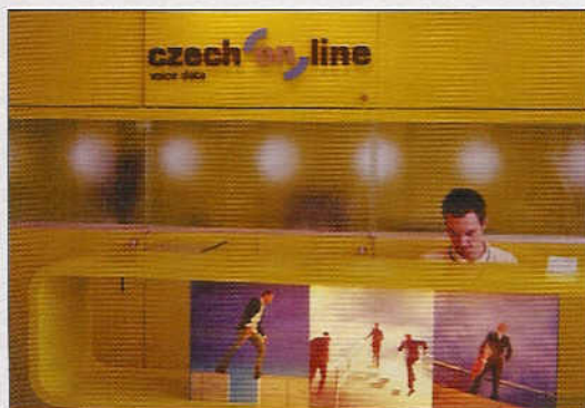
5. Centrum dává i obsluhu prostor k relaxaci. Přijďte na to, co dělá