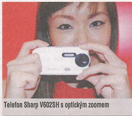
Telefon Sharp V602SH s optickým zoomem